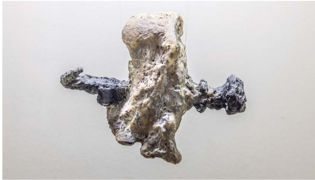
Fußknochen, in dem ein Nagel steckt: archäologischer Nachweis für Kreuzigungen in der Antike.