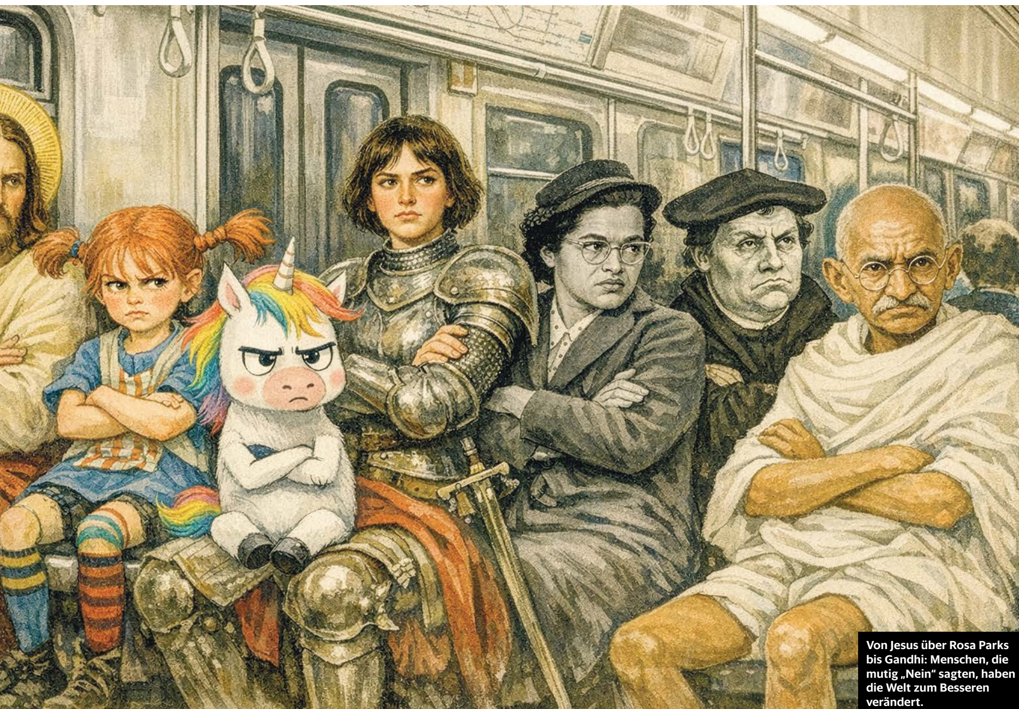
Von Jesus über Rosa Parks bis Gandhi: Menschen, die mutig „Nein“ sagten, haben die Welt zum Besseren verändert.