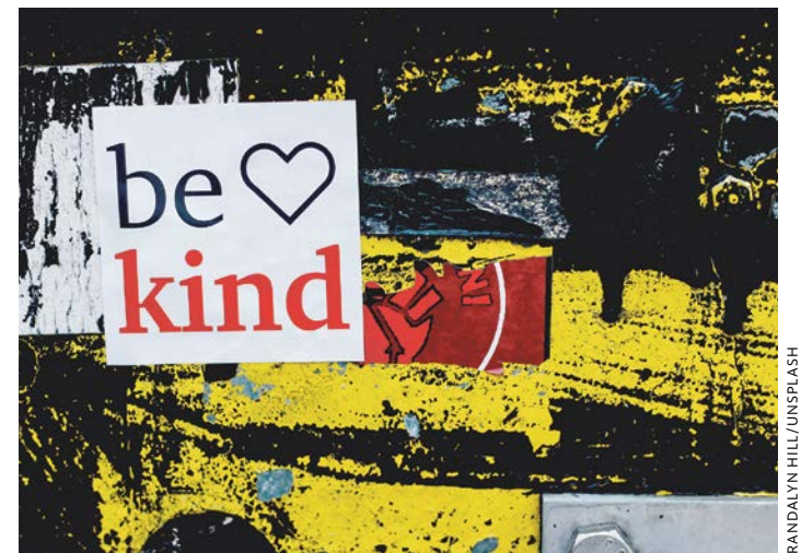
Gerade wo Menschen unter Druck stehen, herrschen oft die härtesten Töne. Umso wichtiger ist es, freundlich zu bleiben.

Die politische Lage tut ihr Übriges. Internationale Vereinbarungen werden gebrochen, imperialistische Eroberungskriege sind offenbar wieder eine Option. Im Inland erklären uns Politiker:innen, wir würden nicht genug arbeiten, während andere vorhersagen, dass KI demnächst alle unsere Jobs überflüssig machen wird. Kein Wunder, dass sich Aggressivität breitmacht.