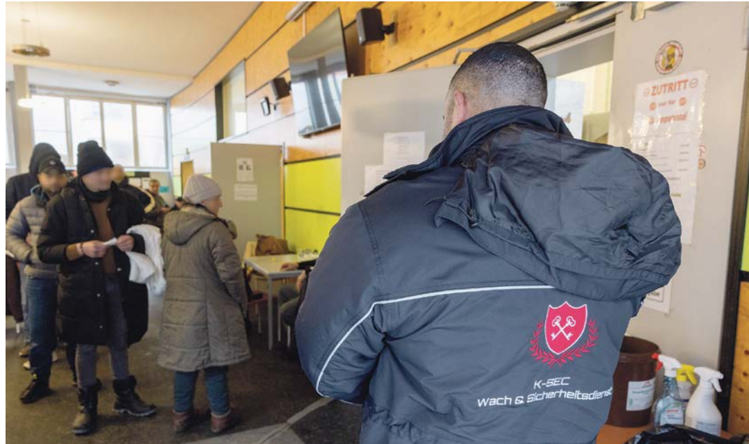
Die Gewalt nimmt zu: Wenn Menschen unter Druck sind, können Konflikte leicht eskalieren.