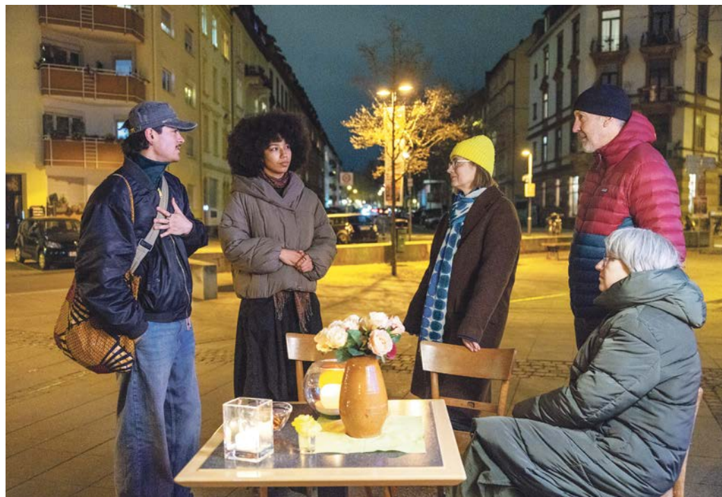
Montags abends kann man vor der Lutherkiche im Nordend mit anderen ins Gespräch kommen.

Klar, mein Kontakt zur alten Gemeinde war schon seit längerem quasi eingefroren, aber dass ich so etwas Großes nicht mitbekommen hatte, ließ mich dann doch schockiert zurück – und mit dem Gefühl, dass da ganz schnell und unbemerkt ein großes Stück Heimat verloren gegangen war.