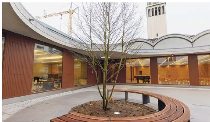
Anbau mit Innenhof neben der Sankt Nicolaikirche im Ostend.

Das Gemeindezentrum Sankt Nicolai in der Waldschmidtstraße/Ecke Rhönstraße ist nach fast zwanzig Jahren Planungs- und Bauzeit im Februar in Betrieb genommen worden. Es schließt nun direkt an die Kirche an; mehrere Türen schaffen die Verbindung. Vom Kirchenraum selbst aus bemerkt man fast nicht, dass die ganze Südwand neu ist. Sogar das Glasfenster-Band, das früher Sonnenlicht hereinließ, leuchtet weiterhin, jetzt allerdings mit künstlichem Licht.